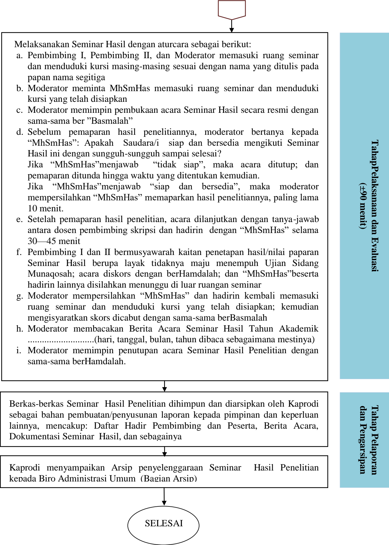
Gambar 1 Diagram Alir Prosedur Penyelenggaraan Seminar Hasil Penelitian Untuk Skripsi Mahasiswa IAI AL-AZIS.